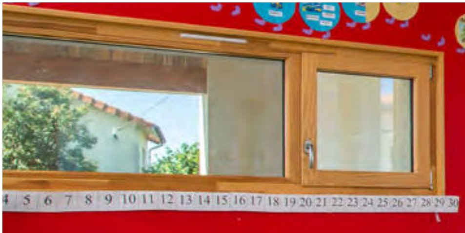
École de Combrand