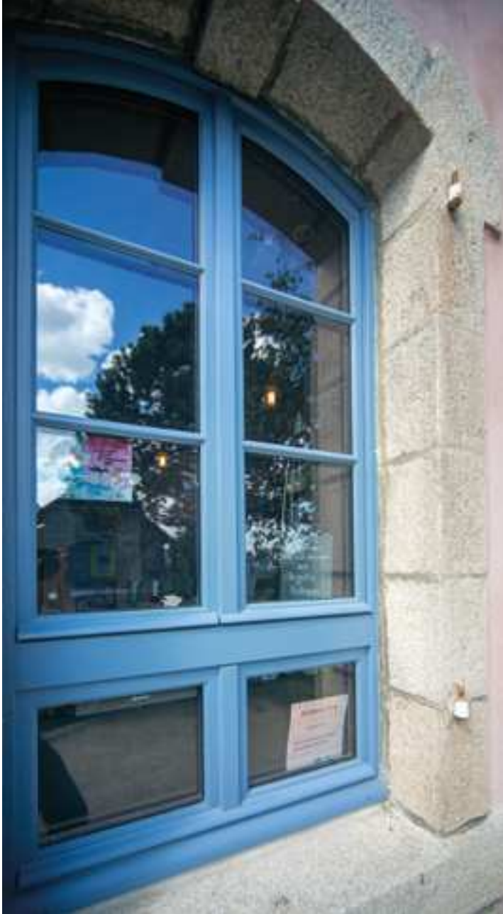
Menuiserie avec imposte cintre surbaissé