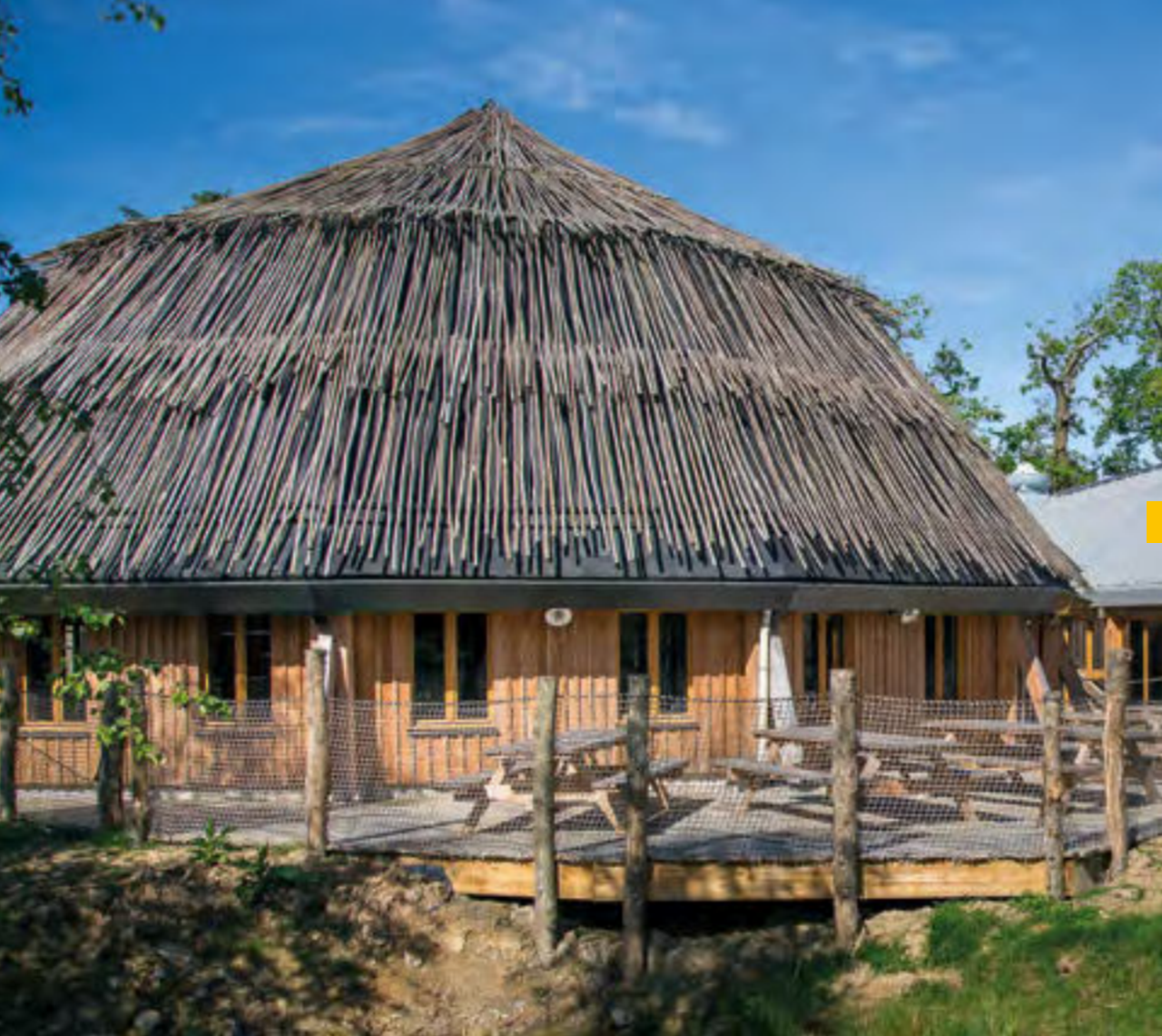
Parc de Branféré, 56190 LE GUERNO